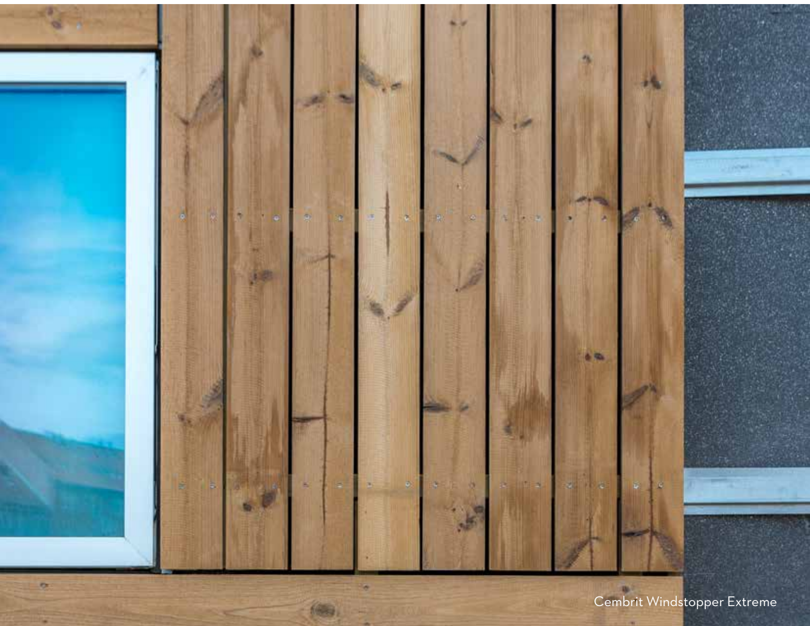
Cembit Windstopper Extreme