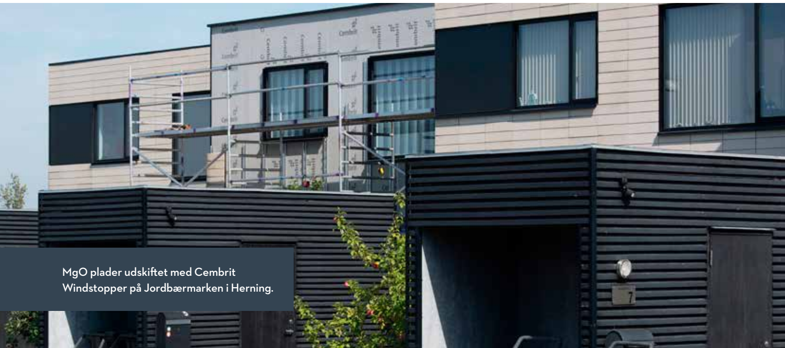
MgO plader udskiftet med Cembrit Windstopper på Jordbærmarken i Herning.