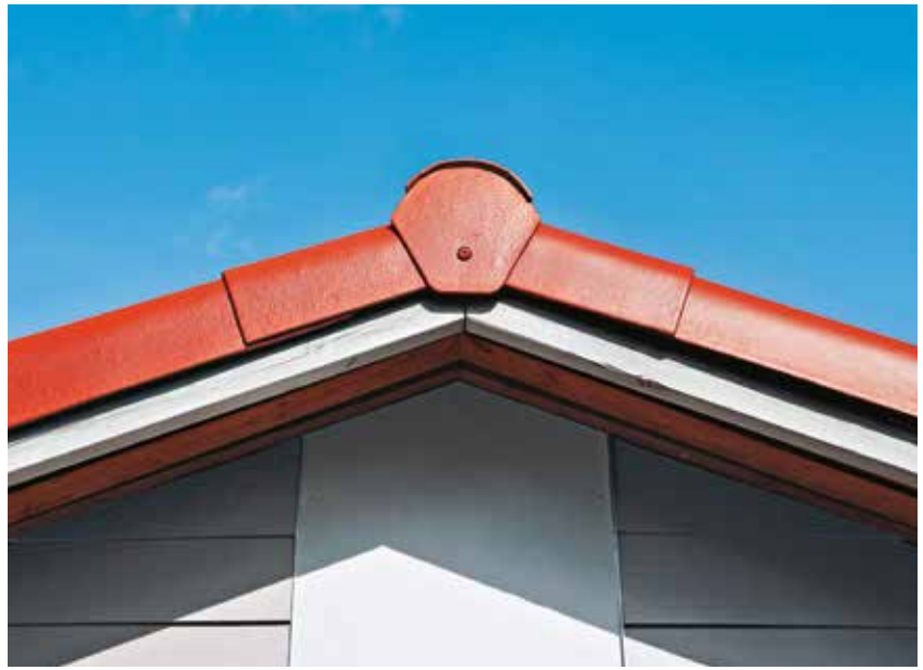
Cembit Toscana Teglørød